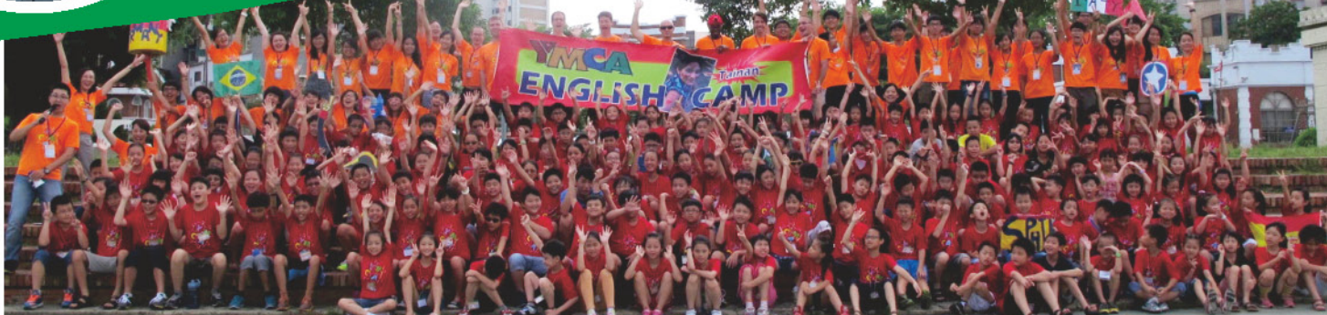
協進教推103年人次如下: 6,387人次

教推部提供相當多的事工讓兒童至青少年學習與成長,在造就、服事、生命上更著力,每年有相當多的學員投入服務學習的行列,生命因著服務隨時在翻轉,明日領袖,今日養成,願神接納與持續的祝福在未來的教推部所有的事工,榮神益人。