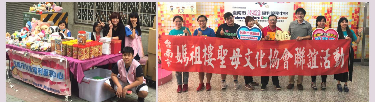
2月25日兒福中心在媽祖樓聖母廟前(忠孝街上)設攤義賣