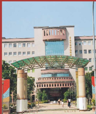
兒童福利服務中心