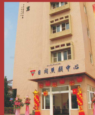
建平日間照顧中心