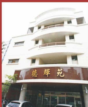
德輝苑臨安養護中心