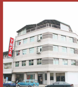
東門失智老人日間照顧中心