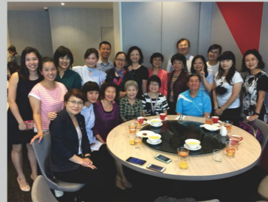
本會義領及同工(B組)參訪新加坡京華YMCA