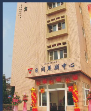
建平日間照顧中心