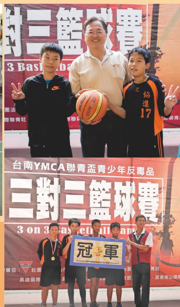
台南YMCA聯青盃青少年反毒品