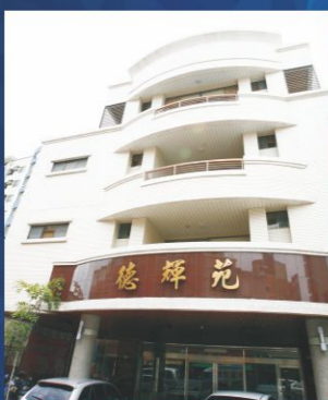
德輝苑臨安養護中心