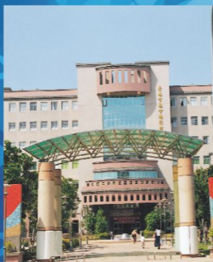
兒童福利服務中心