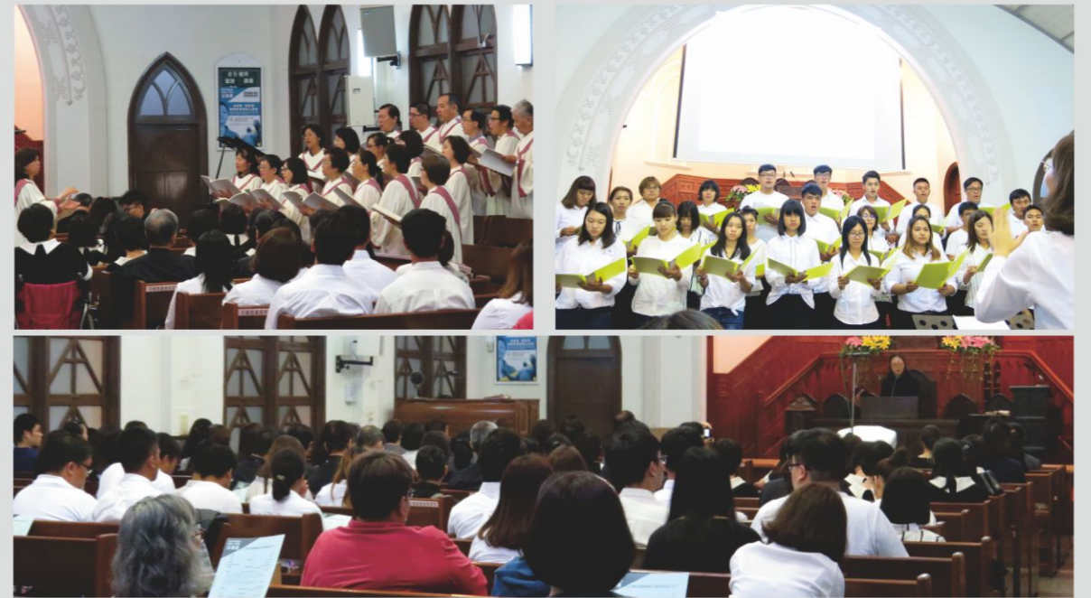
摘自國度復興報 記者商可瑩

VOICE OF THE VOICELESS.」。本會於11月12日(一)晚上7:00假看西街基督長老教會舉辦世界公禱週音樂禮拜，當天有約150人出席參加，本會慈光合唱團看西街教會聖歌隊左鎮教會青年詩班獻詩賈玫婷姊妹公禱以下為此活動的相關報導：