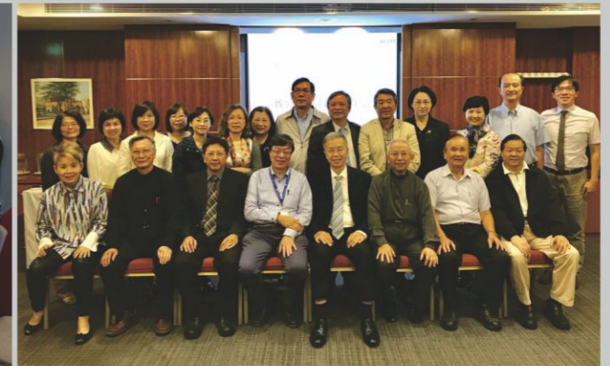
本會義領及同工(A組)參訪新加坡YMCA