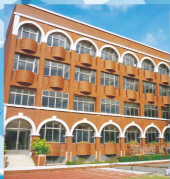
長榮兒少中心·幼兒園

台南市林森路二段79號 (06) 2082517 · 2363005 FAX: 2369291