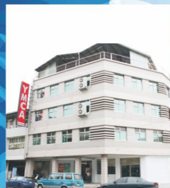
東門失智老人日間照顧中心