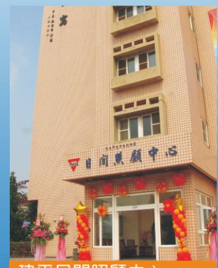
建平日間照顧中心