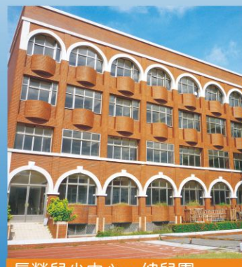
長榮兒少中心·幼兒園

台南市林森路二段79號 (06) 2082517 · 2363005 FAX: 2369291