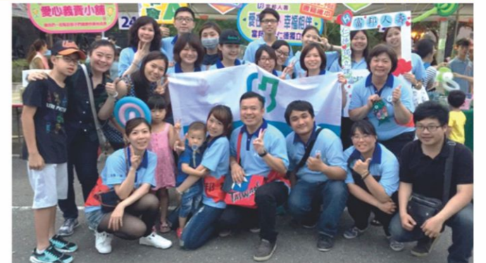
富邦人壽仁德獨立課愛心團隊大合照

每年五月，兒福中心皆於愛與希望園遊會設攤，為幫助中心五個照顧服務據點、近兩百位的弱勢兒童義賣，除了籌募助學基金、寒暑假免費收托照顧服務，還有各據點的課後輔導、照顧陪伴，以及免費的音樂才藝課程、系列品格和小志工培力訓練課程。