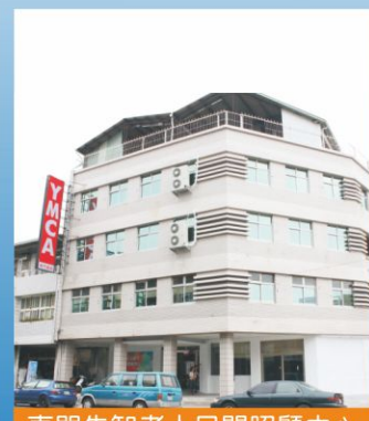
東門失智老人日間照顧中心