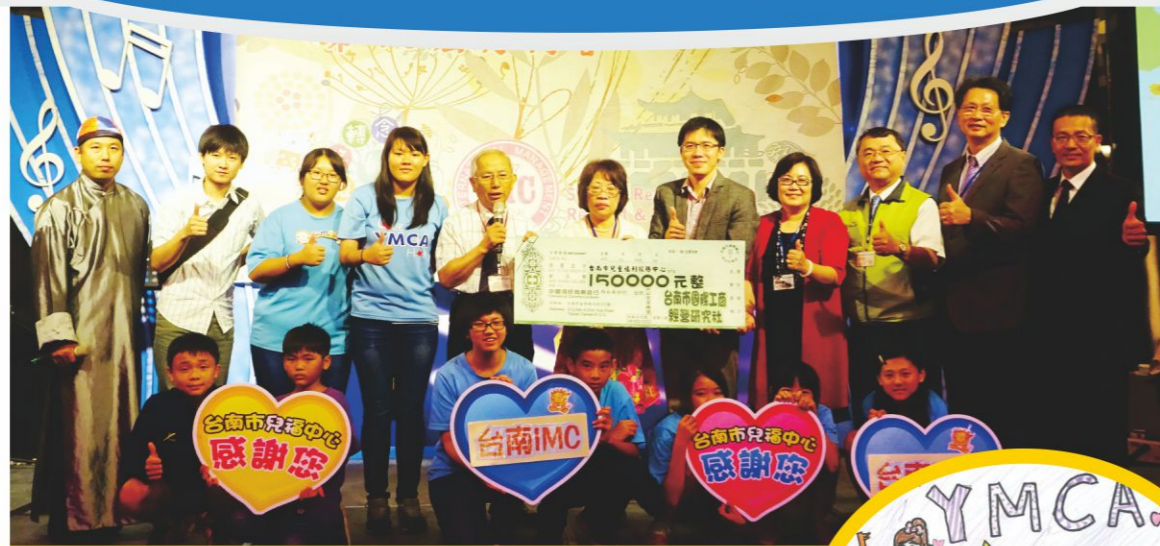
文|社工組 郭佩珊社工

五月是充滿感恩的月份，因許多貴人的陪伴與主的恩典，讓孩子擁有一個夢想的舞台。今年五月，兒福中心(以下簡稱中心)與台南IMC(台南國際工商經營研究社)一同歡慶母親節。