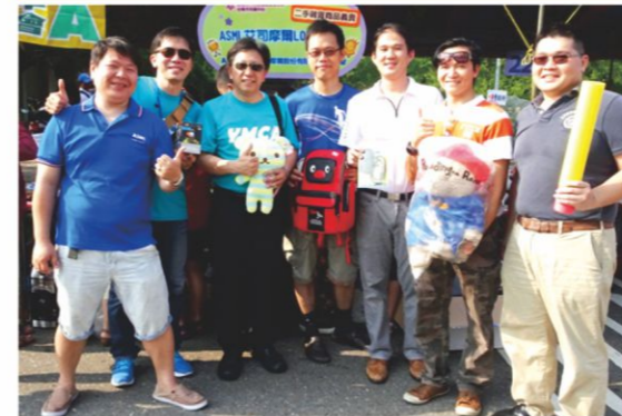
台灣艾司摩爾股份有限公司台南與林口分公司現場支援