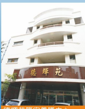
德輝苑臨安養護中心