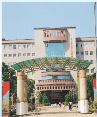
兒童福利服務中心