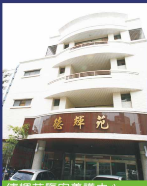
德輝苑臨安養護中心