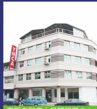
東門失智老人日間照顧中心