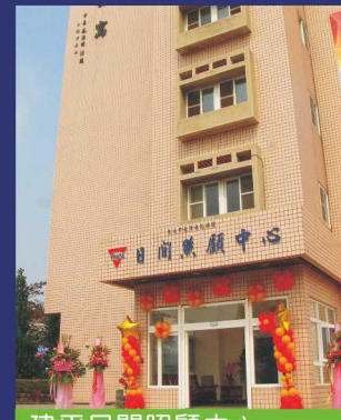
建平日間照顧中心