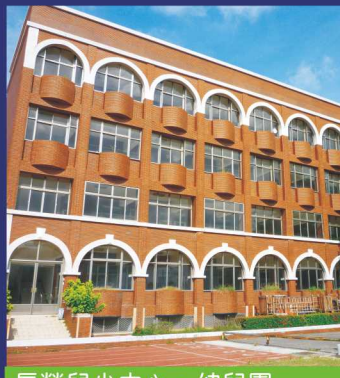
長榮兒少中心·幼兒園

台南市林森路二段79號 (06)2082517 · 2363005 FAX: 2369291