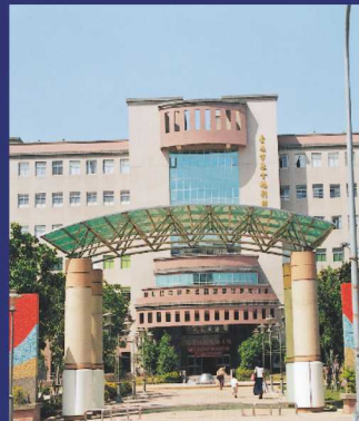
兒童福利服務中心